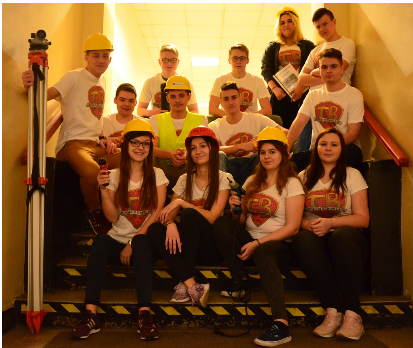
Klasa IIBT w komplecie