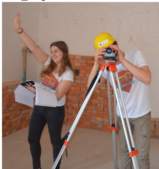
W tym zawodzie trzeba mieć dobre oko