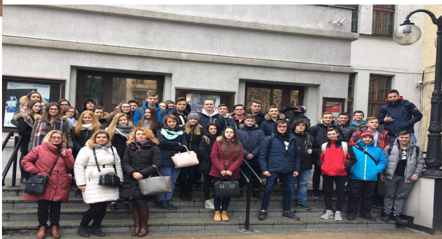
Uczniowie IET, IBT i IALO przed teatrem w Łodzi