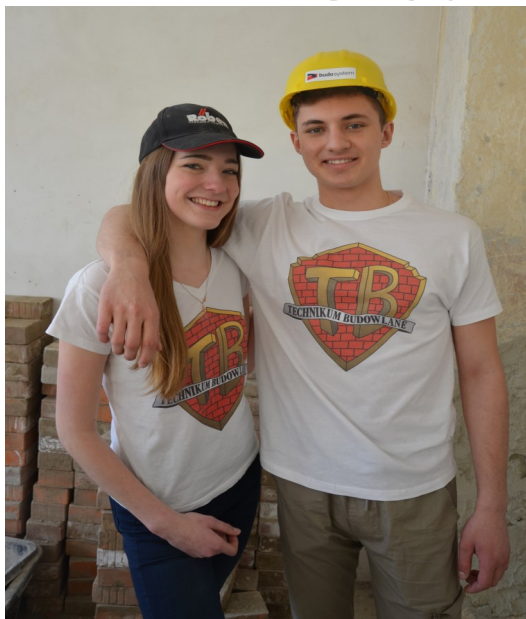
Najważniejsze to partnerstwo