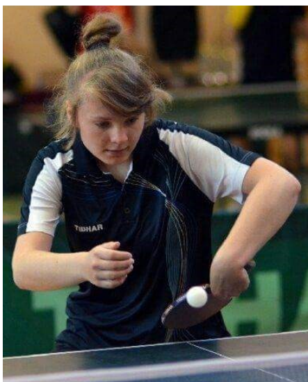
Skupienie to podstawa

Myślę, że każdy chciałby wygrać ten plebiscyt, jeśli chodzi o mnie sądzę że wszystko jest w rękach ludzi, którzy mnie oglądają i mi kibicują. Mimo