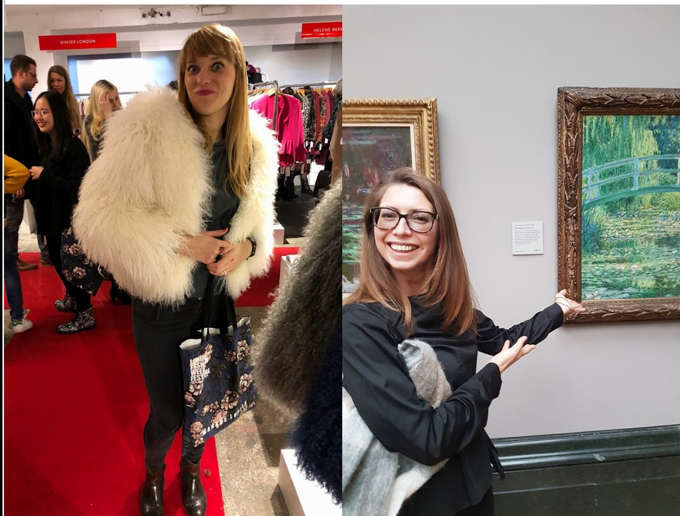
Wycieczka do Londynu—Fashion Week - British Museum - Niezapomniane wrażenia.

Niektórzy tam byli i buszowali wśród niesamowitych kreacji. W Londynie już wiosna w kratę, a lato w kolorze.