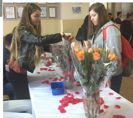
Walentyńkowa sprzedaż kwiatów