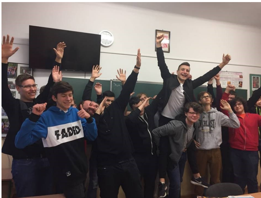
IET zachwycona wynikami

Z nane są wyniki XX jubileuszowego Ogólnopolskiego Rankingu Liceów i Techników Perspektywy 2018. W rankingu uwzględniony został również Zespół Szkół Centrum Kształcenia Praktycznego. W tym roku po raz kolejny szkoła awansowała. W województwie mazowieckim o 16 miejsc, z pozycji 58 na pozycję 42. Tylko 6 miejsc dzieli ją od otrzymania Brązowej Tarczy. To nie jedyny sukces ZS CKP odnotowany przez miesięcznik Perspektywy w ostatnich latach.