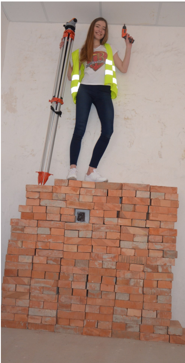
Dziewczyna na szczycie

Dzięki zajęciom dodatkowym i możliwości korzystania z różnych szkoleń zdobywamy nowe umiejętności, by w przyszłości stać się zawodow-