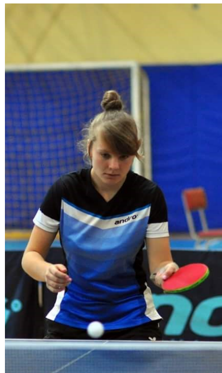
Płeczka słucha się jej

Tak, pod koniec lutego odbędą się zawody ogólnopolskie, w których chciałabym pokazać swoją wysoką formę i przedstawić się z jak najlep-