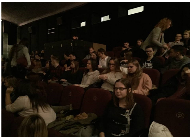
Uczniowie Osiemdziesiątki w pierwszym dniu festiwalu